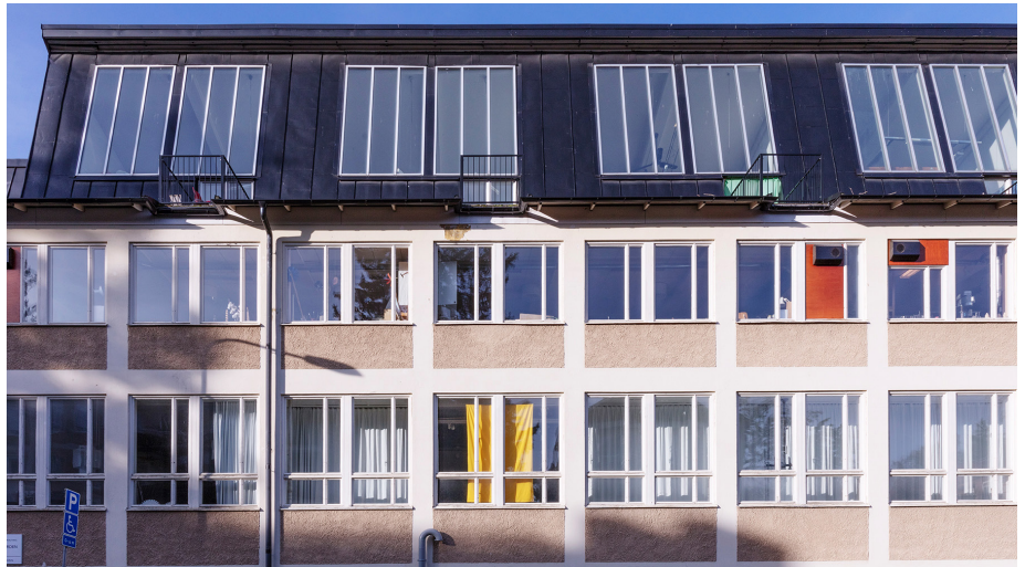
Konsthall C fasad.

Konsthall C grundades 2004 och beskrivs på sin hemsida som "ett offentligt konstverk, stadsförnyelseprojekt och en konstinstitution belägen i en före detta tvättstuga i Hökarängen." Verksamheten startade som ett konstnärligt experiment och samarbete mellan konstnären Per Hasselberg, Hökarängens stadsdelsråd, Stockholmshem och Moment:teater. Hökarängens stadsdelsråd hade sedan tidigare arbetat för ett vitalt kultur- och föreningsliv i området och Pers konstnärskap