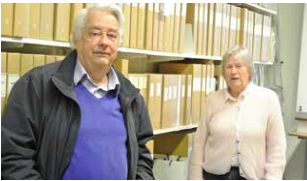
GA adjungerad till styrelsen f.d. riksdagsledamot

Vårt motto är: Vi samlar informationer om dåtiden i nutiden för framtiden.