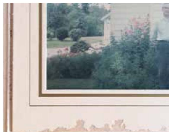
Färgfoto som bleknat och ramen angripen av skadedjur.