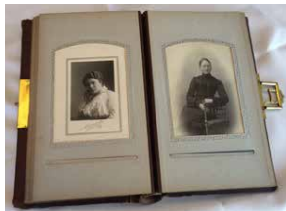
Familjealbum från tidigt 1900-tal.