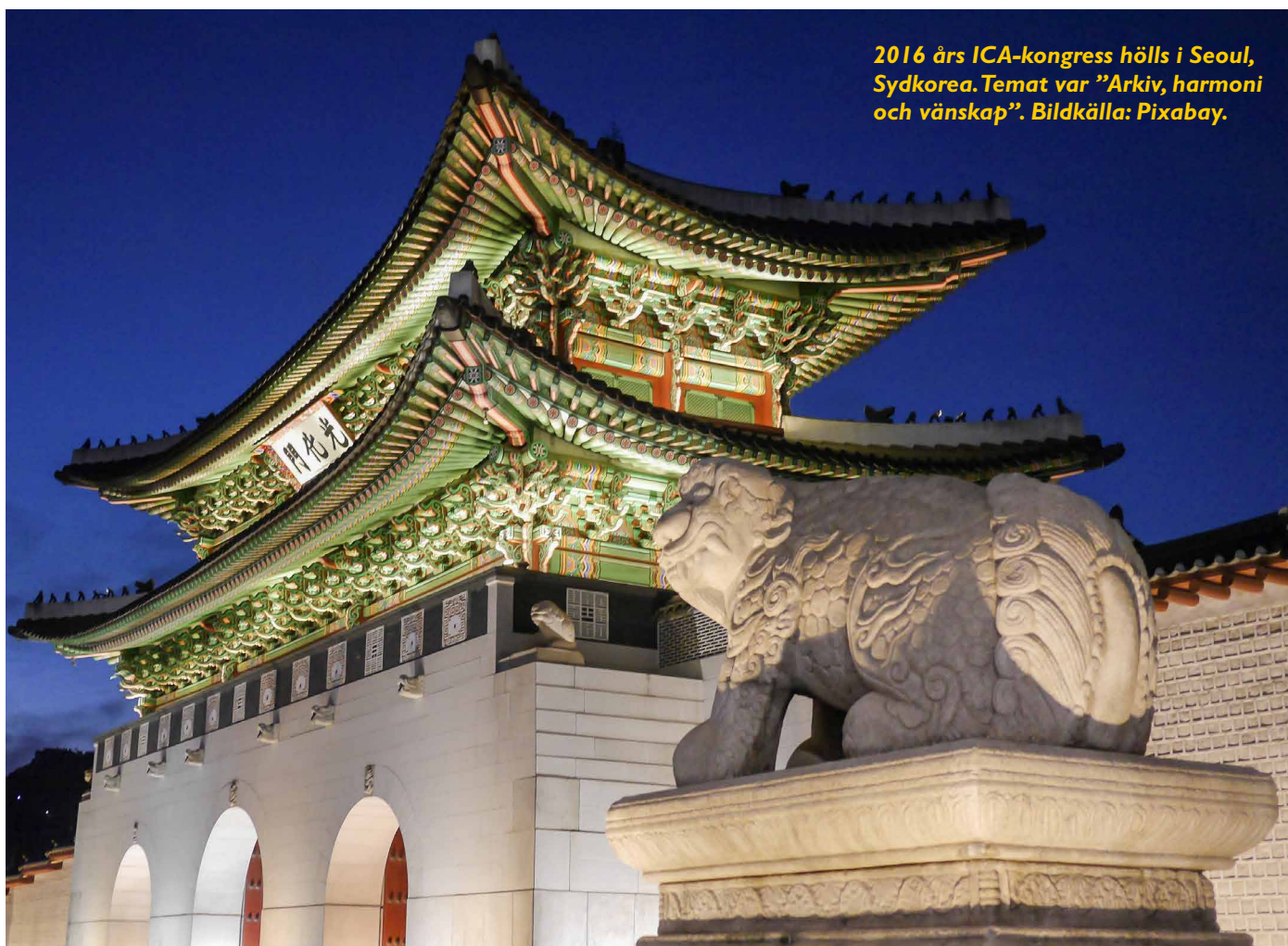
2016 års ICA-kongress hölls i Seoul, Sydkorea. Temat var "Arkiv, harmoni och vänskap".

De kungliga annalerna upprättades mellan 1392 och 1863, dvs. under totalt 472 år, och är med sina 1893 volymer världens i tid längst förda källa om en enskild kungadynasti. Annalerna skrevs på klassisk kinesiska. För att göra dem begripliga för dagens koreaner fick de därför först