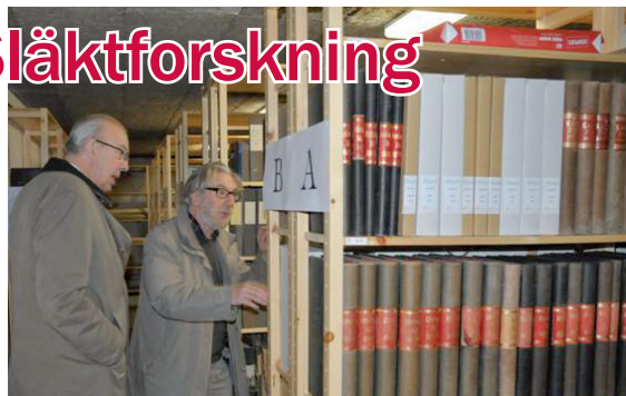
Upplands-Bro Arkivförening bildades 5 nov 2012.

Själv har jag en intressant koppling till Brogårds arkiv. När vi skulle sätta etiketter på kartonger och