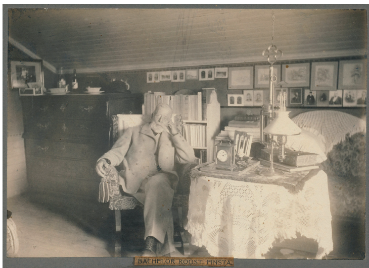
Det rofyllda livet i ungarlyslyan i Finsta stationshus.