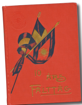
10 års Fälttåg av Emanuel Hellberg.