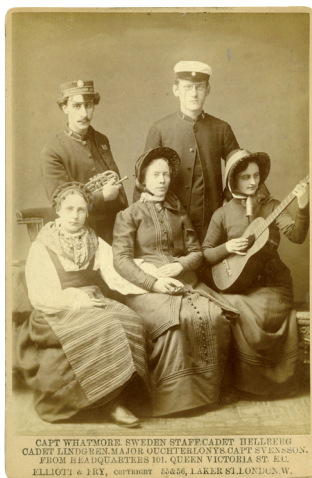
Englandsresenärer, sommaren 1884.

år 1962 (FA-press). Laura Petris skildringar om faster Hanna, hennes liv och gärning är detaljrik och levande. Den är skriven som en avhandling med brevcitat och noter med källor - ett utmärkt dokument om den tidens "religions"-strider och kvinnokamp d.v.s. kvinnans rätt att predika Guds ord som värnades av moderkyrkan The Salvation Army.