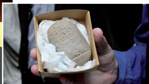
Speciellt för denna visning - ett arkiverat dokument - i form av en lertavla med kilskrift från 1800-talet f.Kr.