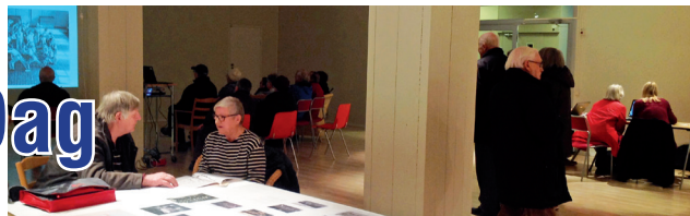
Arkivens Dag på Nynäshamns Bild- och Folkrörelsearkiv

Arkiven har en egen dag runt om i landet, andra lördagen i november. Då håller arkiv och föreningsarkiv öppet för allmänheten för att visa spännande utställningar, föredrag och annat som kan intressera en publik. I år var ämnet Orostider.