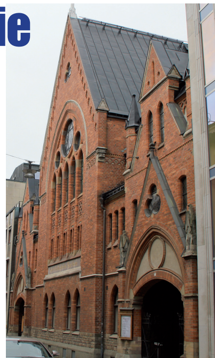
Trefaldighetskyrkan ligger insprängd mitt bland kontorsfastigheter på Östermalm.

Nu kan eftervärlden ta del av allt värdefullt arbete Trefaldighets församling, idag Equmeniakyrkan, ägnat Stockholmsmarna.