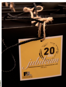
Goodiebag innehållande bl a ett nytryckt exemplar av FSL jubileumsskrift.