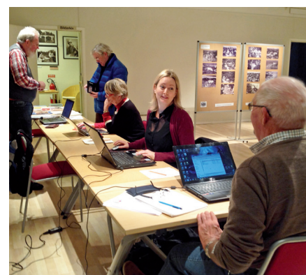
Nynäshamns släktforskarförening hade representanter på plats.

holms Härads Hembygdsförening. Det fanns även en mindre utställning om Konsumhuset med ritningar och fotografier från 1934. I det angränsande "Sagorummet" visades två korta