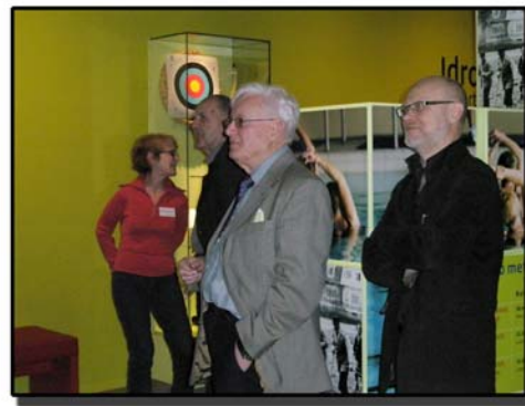
En trevlig visning av riksidrottsmuseet fick vi också

Ordna och Vårda föreningsarkiven ges ut av