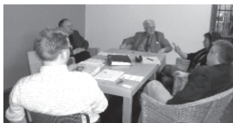
Ett givande utbyte av erfarenheter i Stadsarkivet