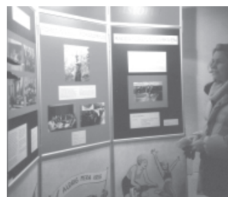
Föreningsarkivens bildskärm väckte uppskattning