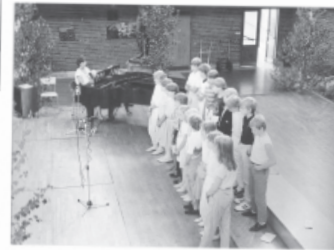
Bilder från Mariekällskolan lämnades in

var material som den 1997 nedlagda grundskolans personal lämnat in. Det visade sig var ett lyckokast för att locka folk. Arkivens Dag blev för besökarna minnenas dag med foton i stor mängd, videoupptagningar och mängder av skolmaterial från perioden 1950-1997. Vi annonserade i Länstidningen