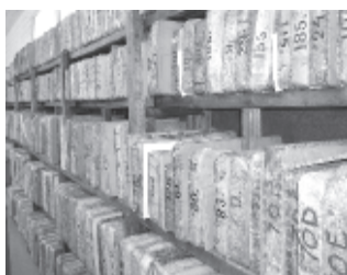
Ett arkiv av sten

Museet som också kan kallas Litografiska museet ligger väldigt vackert vid sjön Ormlången i ett rekreativsområde i Huddinge kommun som heter Sundby gård. Museet är öppet för besök.