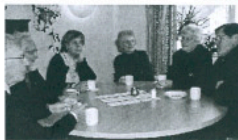
Delar av arkivgruppen runt fikabordet

Arkivet har också funnits här sedan 1966 och en första utställning kom på plats 1986. Den utställning som vi kommer att få se på vårt möte är nyuppförd och invigdes 2005.